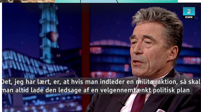
Det, jeg har lært, er, at hvis man indleder en militæraktion, så skal man altid lade den ledsage af en velgennemtænkt politisk plan