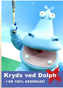
Kryds ved Dolph - I ER 100% ASSHOLES!