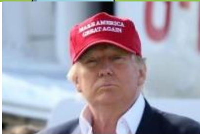
DOLPH og hans venner